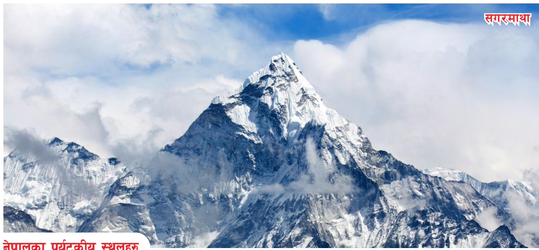
नेपालका पर्यटकीय स्थलहरू