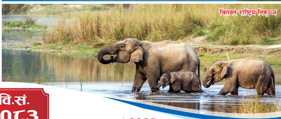
चितवन राष्ट्रिय निकुञ्ज