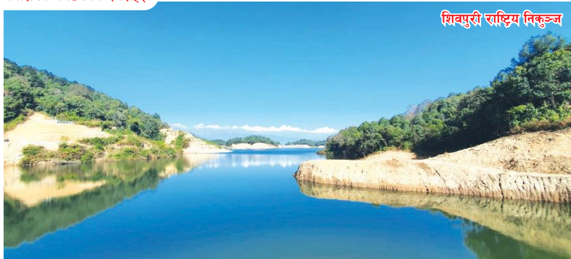
शिवपुरी राष्ट्रिय निकुञ्ज